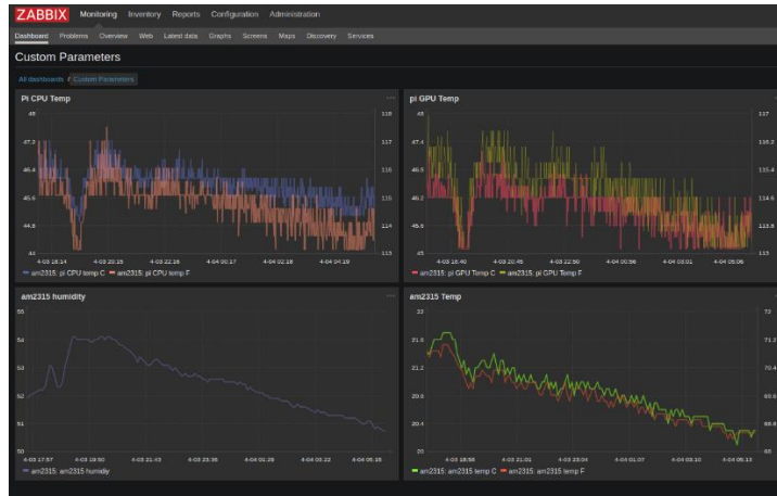
Рисунок 1 – как Zabbix

Были изучены возможности применения таких инструментов, как Zabbix и Grafana, которые широко используются для централизованного сбора и визуализации данных о состоянии ИТ-оборудования (см. рисунок 1).