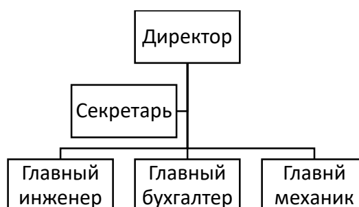
Рисунок 1.2 – Организационная структура