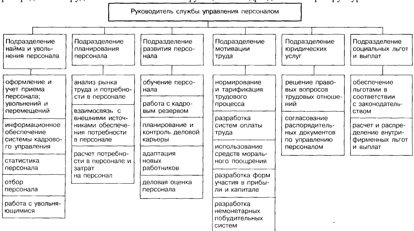
Рис. 3.5. Схема оргструктуры службы управления персоналом

Проанализировав организационную структуру службы управления персоналом, а также используя общие статистические зависимости, известные в системе управления персоналом ведущих отечественных и зарубежных фирм, необходимо выбрать по табл. 3.5 тот вариант соотношения численности, который является наиболее распространенным в практике ведущих организаций. Аналогично по табл. 3.6 следует выбрать наиболее оптимальный вариант распределения трудоемкости выполняемых функций по подразделениям оргструктуры.